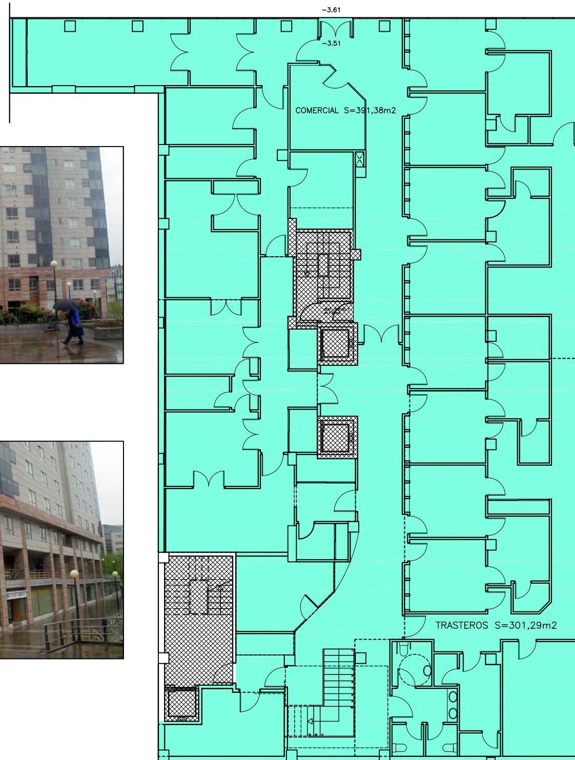
PLANTA BAJA 692.67 M2